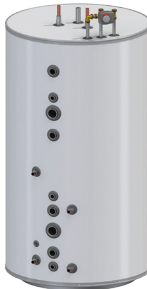
Nordic värmeberedare TIP systemtank används i kombination med de flesta av våra värmekällor och där man önskar anslutningar i fronten och en tank som är något bättre isolerad samt har en större vattenvolym än våra fyrkantiga tankar t ex vid mer sol och större effekt på kamin.