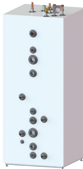
Nordic värmeberedare TIV 500 systemtank används i kombination med de flesta av våra värmekällor och där man önskar anslutningar i fronten.

Solslinga, shuntstyrning, cirkulationspump, extra elpatron, expansionskärl.