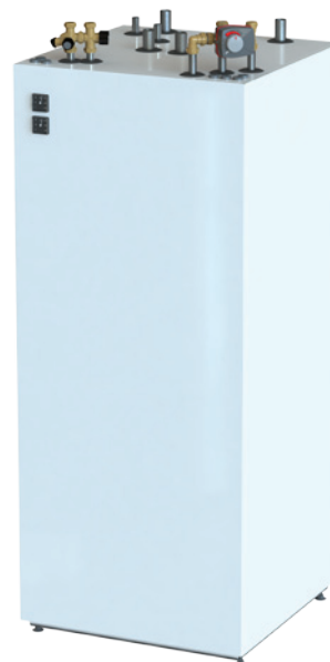
Nordic Värmeberedare TIDA 500, en toppmonterad vitlackerad tank. En flexibel tank då man vill kombinera flera olika värmekällor.

Till skillnad mot många andra system där man låser sig kring ett värmesystem är vårt system flexibelt att komplettera med olika extern värmekällor som t.ex. solpaneler på taket eller en vattenmantlad kamin i vardagsrummet. Investeringarna gör man när man själv vill och i den takt man själv önskar.