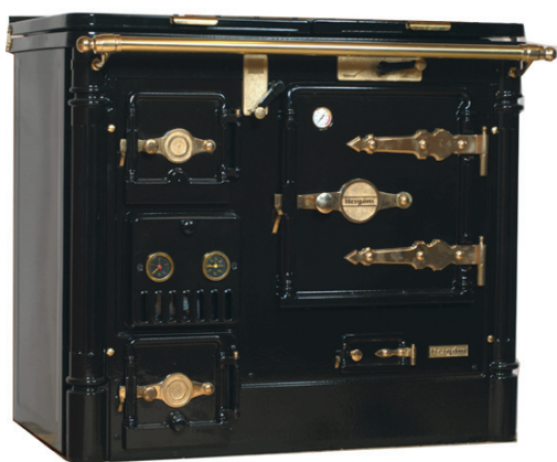
Classical modell 8