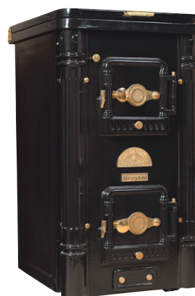
Classical modell 5