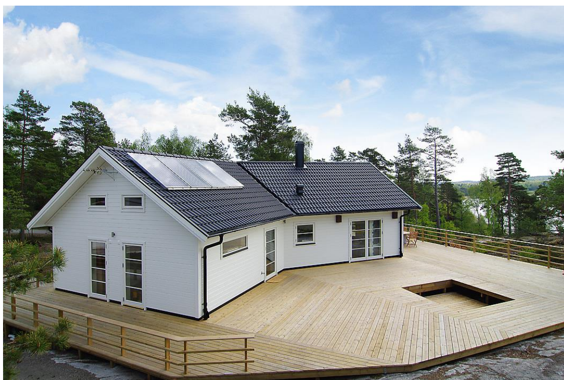
Solpaket Borö SRC 8 m2.

Solfångare ger dig värme och energi under stora delar av året (8-9 månader). Det är en billig och miljövänlig värmekälla med lång livslängd och enkel installation. I offerten ser vi vad som ingår i leveransen. Vi erbjuder olika typer av paket beroende på typ av systemlösning. I offerten framgår exakt leveransinnehåll.