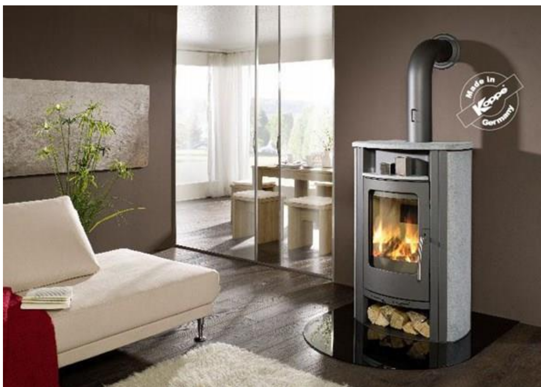
Braskamin Caron Aqua med tillbehör. Skorsten ingår ej i offert nedan.

Med en vattenmantlad braskamin fördelar man värmen till hela huset och till tappvarmvattnet, man får bättre komfort i huset och det ger dig möjlighet att elda längre än med en vanlig kamin utan att det blir för varmt i det rummet som kaminen står i. På så sätt har du möjlighet att påverka dina energikostnader till ett minimum även under de kalla vintermånaderna.