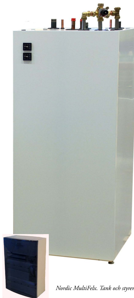
Nordic MultiFlex. Tank och styrenhet